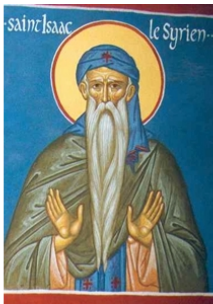
Fresque de la chapelle Notre-Dame et St-Thiébault

S eigneur Jésus-Christ Notre Dieu, qui as pleuré Lazare et versé sur lui les larmes de l'angoisse et de la compassion, reçois les larmes de mon amertume.